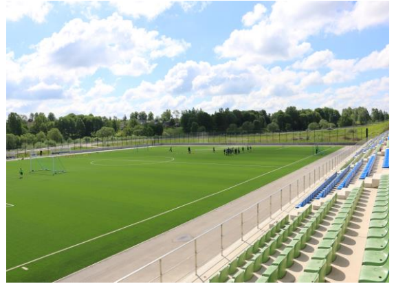
SIA "Olimpiskais centrs Rēzekne" mākslīgā seguma futbola laukums.