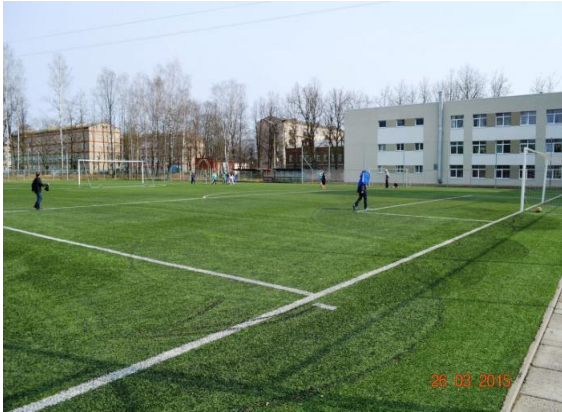
Rēzeknes 2.vidusskolas laukums.