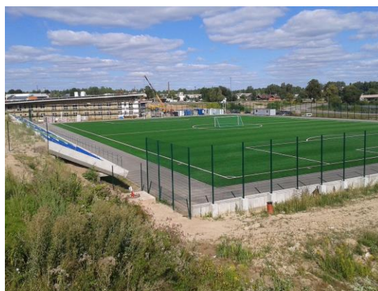
SIA "Olimpiskais centrs Rēzekne" mākslīgā seguma futbola laukums