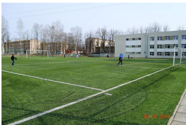
Rēzeknes 2.vidusskolas laukums